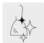
Pulido espejo para fácil limpieza